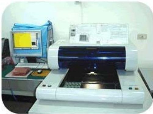
➤ A.O.I：MARANTZ M22X CL-450