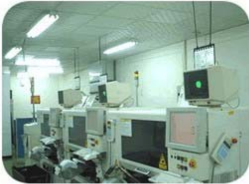
I 線 & II 線